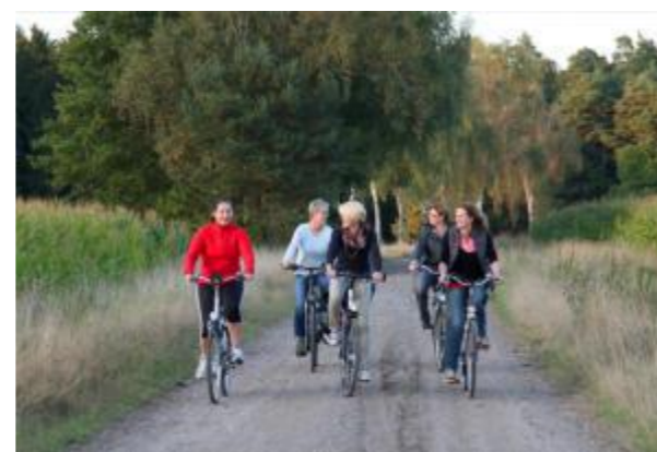
Leine-Heide-Radfernweg in Dorfmark