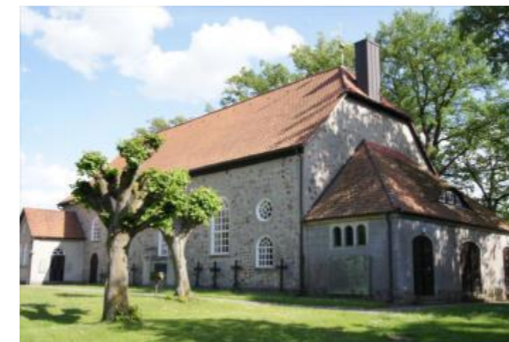
Kirche St. Martin in Dorfmark