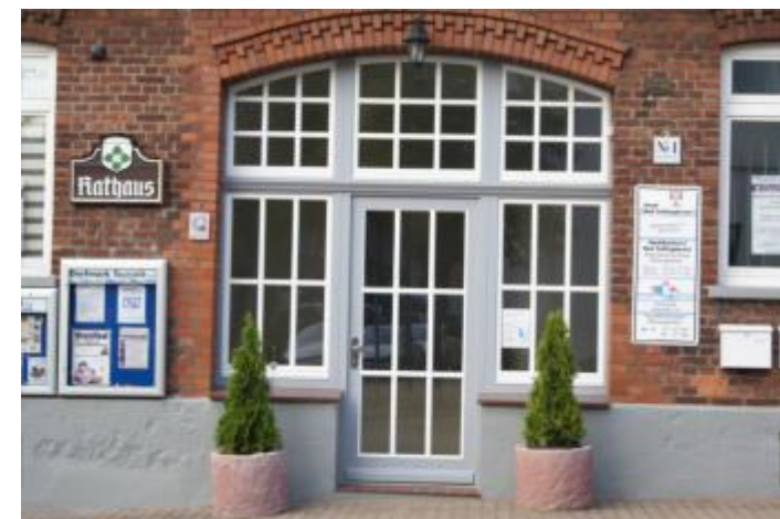
Altes Rathaus in Dorfmark mit Tourist-Information und Bücherei

Raiffeisen-Markt Reitsportartikel, Tierbedarf + Futtermittel, Justus-von-Liebig-Straße 1 05163 980921